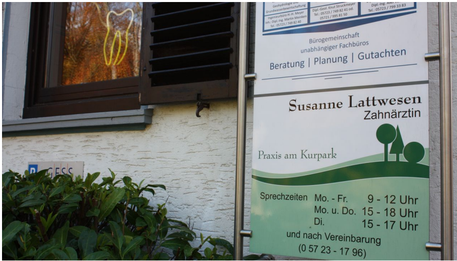
3 Zahn#rztin Susanne Lattwesen CCO 5.JPG