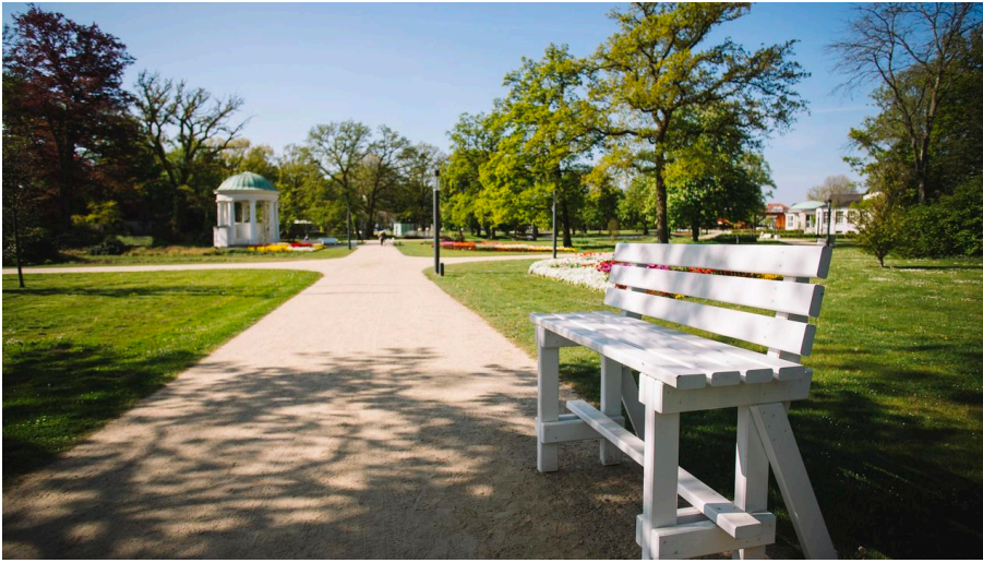
Baumelbank Kurpark Bad Salzuflen