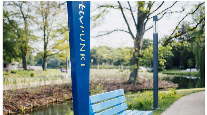
Baumelbänke im Kurpark Bad Salzuflen