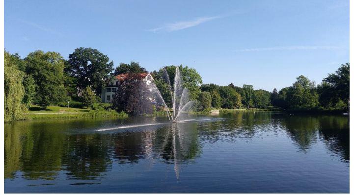
Kurparksee Bad Salzuflen - © Stadt Bad Salzuflen/K. Paar