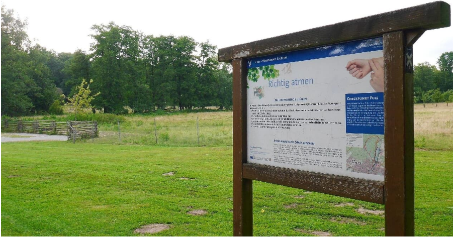
VitalWanderWelt Salzetal