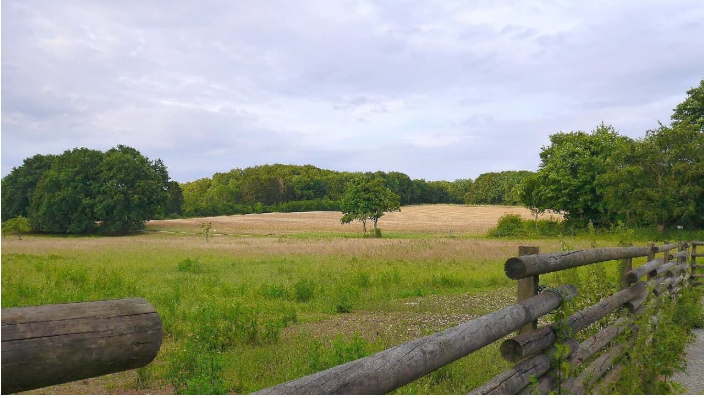
Landschaft am VitalWanderWeg Salzetal