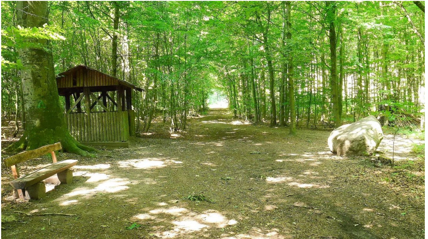
Karl-Bachler-Gedenkstein und Rastplatz - © Stadt Bad Salzuflen/K. Paar