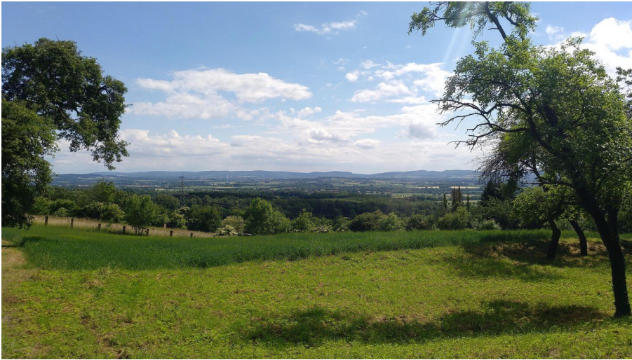
Wanderweg 1 Aussicht von Hollenstein