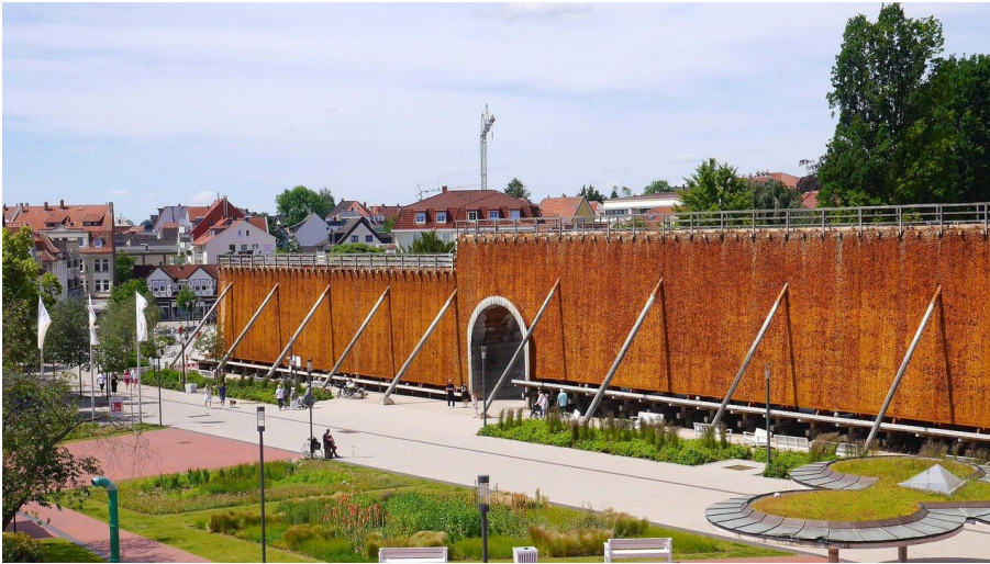
Gradierwerk Bad Salzuflen