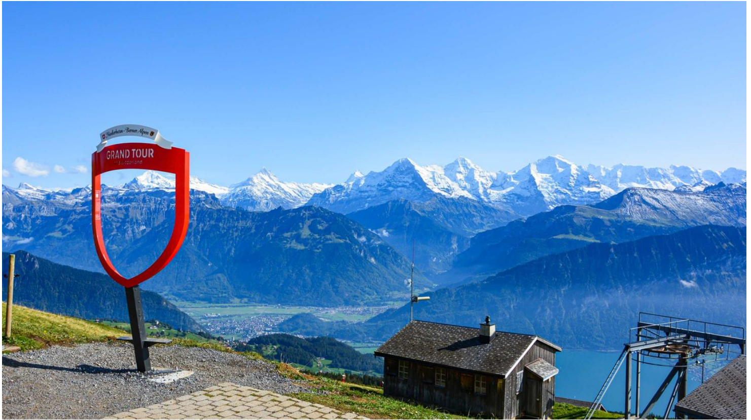
grand-tour-foto-spot-niederhorn-sommer.jpg