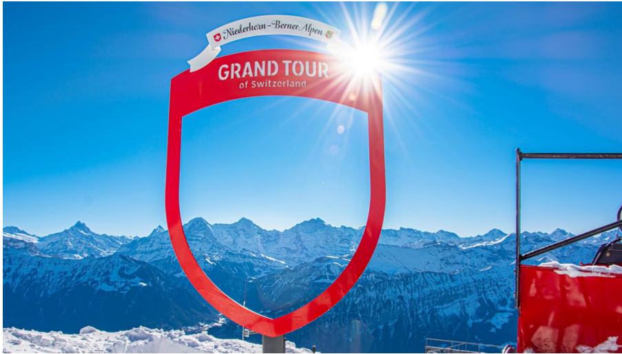
grand-tour-foto-spot-niederhorn-winter.jpg