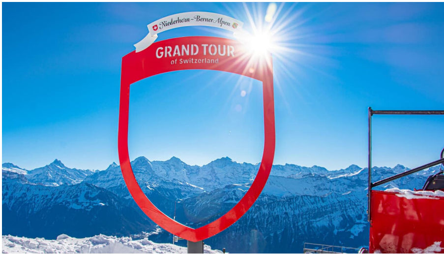
grand-tour-foto-spot-niederhorn-winter.jpg