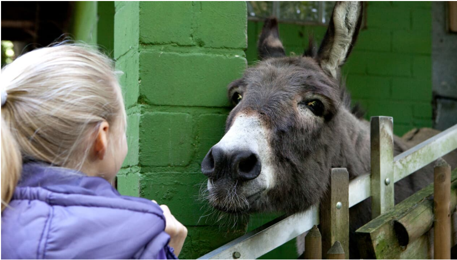
Märchenzoo Blauer See in Ratingen