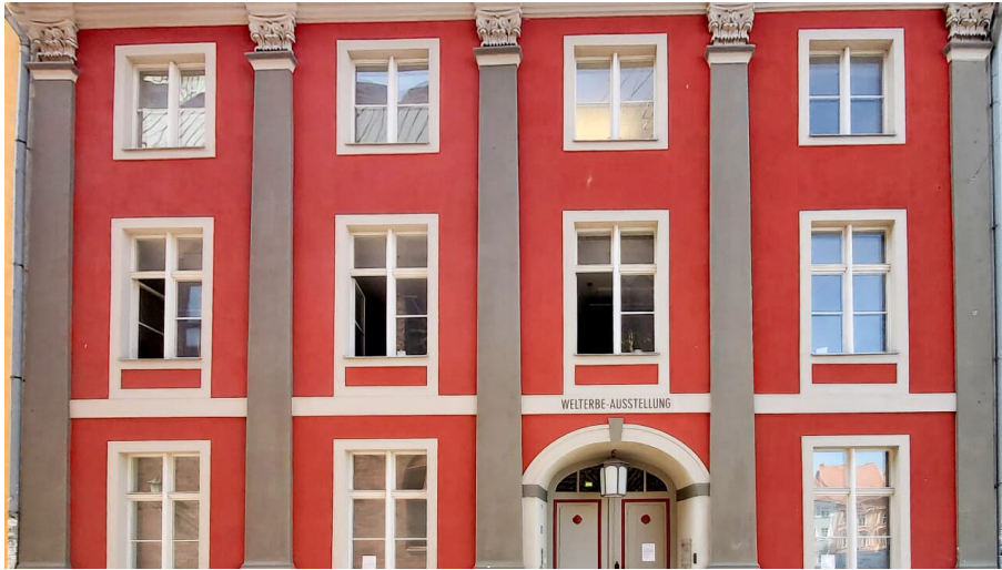
Welterbemuseum Ossenreyerstraße (3)