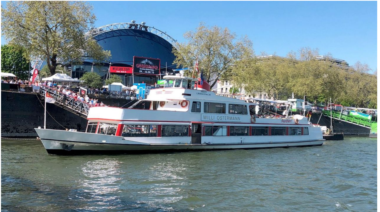
DSC-Einstieg-DSC-Dampfschiffahrt-Colonia-GmbH .jpg - © Dampfschiffahrt Colonia GmbH