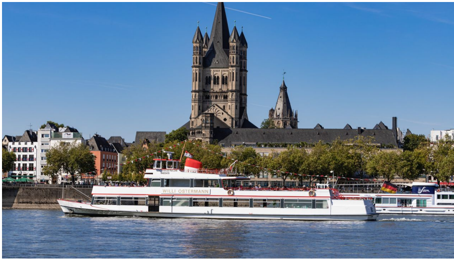
DCS-Altstadt-DSC-Dampfschiffahrt-Colonia-GmbH .jpg