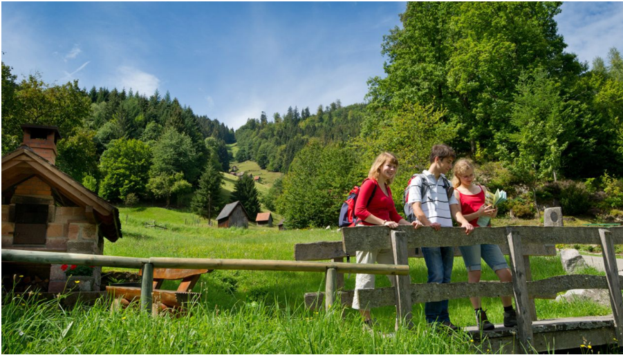
Wandern bei der Ebet-Mühle in Forbach