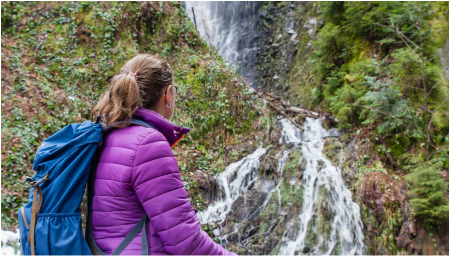
Griesbacher Wasserfall