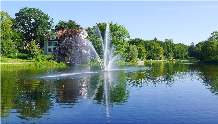
Kurparksee - © Stadt Bad Salzuflen/K. Paar