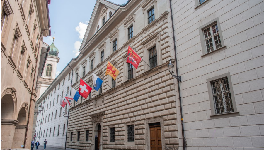
Le palais Ritter