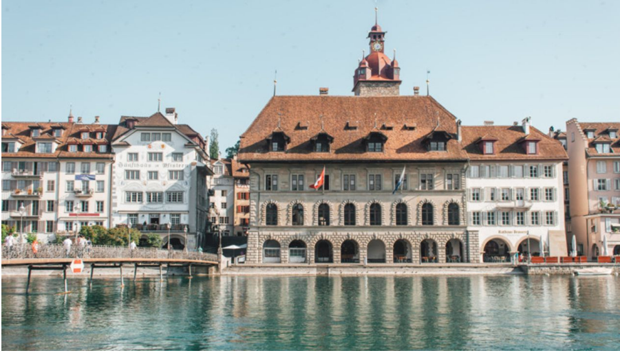
L'hôtel de ville