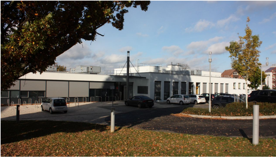
Kurhaus 8.JPG