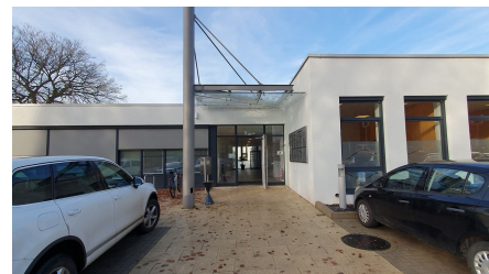
Kurhaus Bad Nenndorf - Eingang