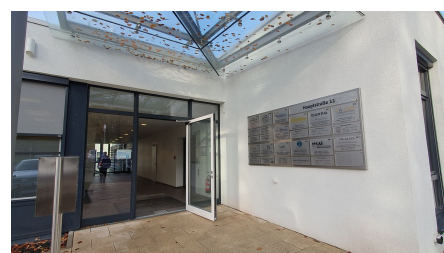
Kurhaus Bad Nenndorf Eingang