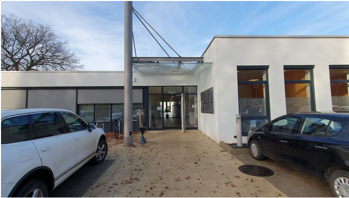
Kurhaus Bad Nenndorf - Eingang - - tourist-info@badnenndorf.de