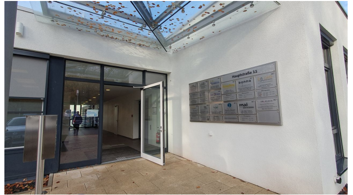
Kurhaus Bad Nenndorf Eingang - - tourist-info@badnenndorf.de