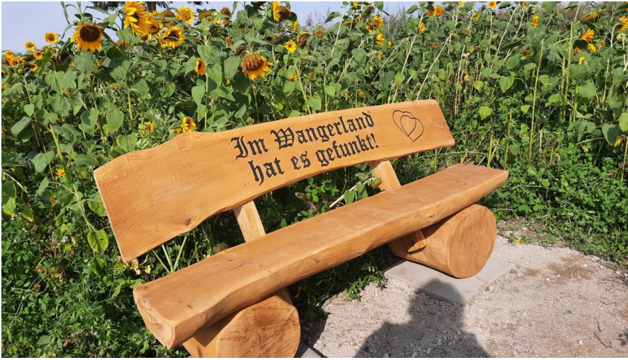
POI-Eichenbank mit Sonnenblumen-Bassens.jpg

Sport, Freizeit und Aktivitäten sonstige