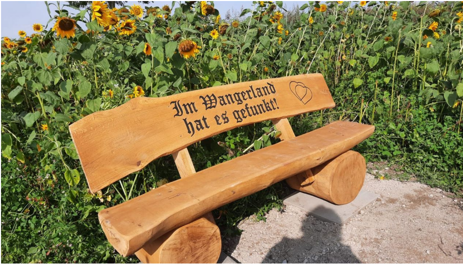
POI-Eichenbank mit Sonnenblumen-Bassens.jpg

Sport, Freizeit und Aktivitäten sonstige