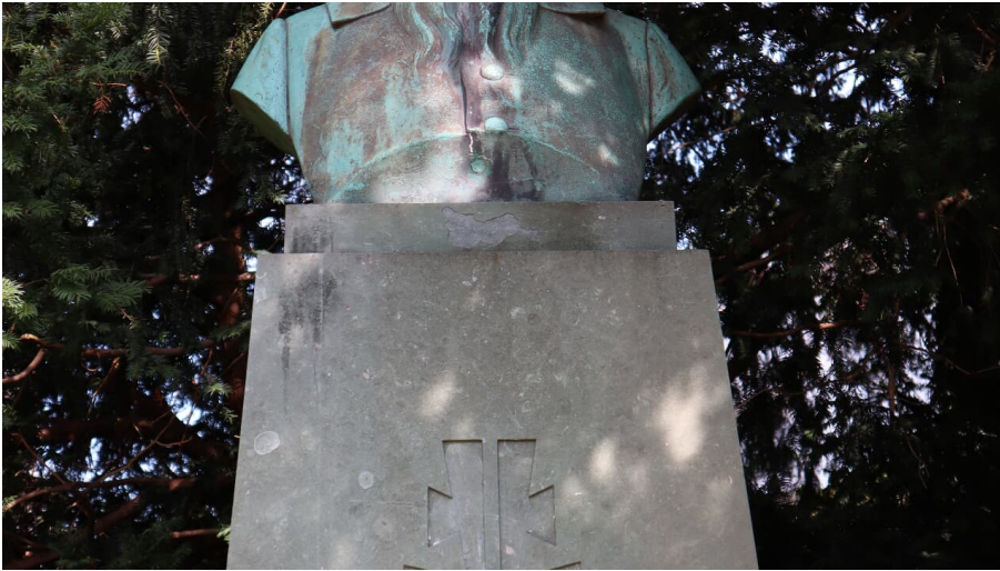
Jahn-Gedenkstein (4)JPG

1907 wurde an der Stiftberger Straße, die in diesem Zusammenhang in Jahnstraße umbenannt wurde, ein Denkmal zu Ehren Friedrich Ludwig Jahn (1852-1952), auch Turnvater Jahn genannt, aufgestellt.