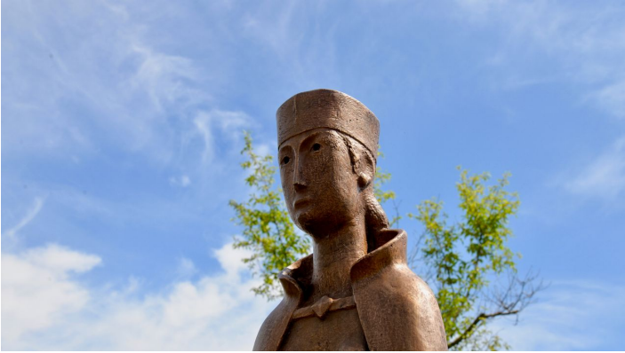
Mathilde Portrait