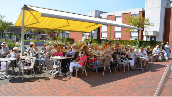
Schattiges Plätzchen