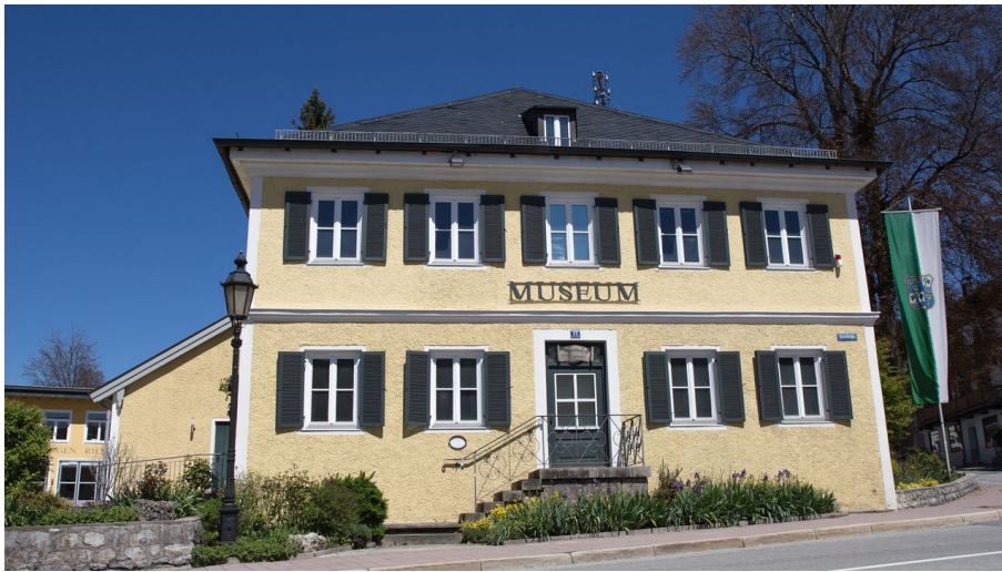
Museum Tegernseer Tal