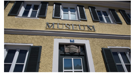
Museum Tegernseer Tal