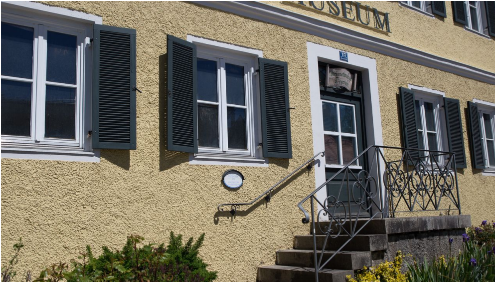
Museum Tegernseer Tal

Weitere Termine werden jeweils bekanntgegeben. - Frohnleichnam (16.06.) geschlossen. Führungen für Gruppen sind auch außerhalb der regulären Öffnungszeiten jederzeit möglich. Bitte vereinbaren Sie einen Termin unter Tel. +49 8022 4978 oder +49 8022 4862 oder +49 8022 3375. Winterpause von November - Mai!