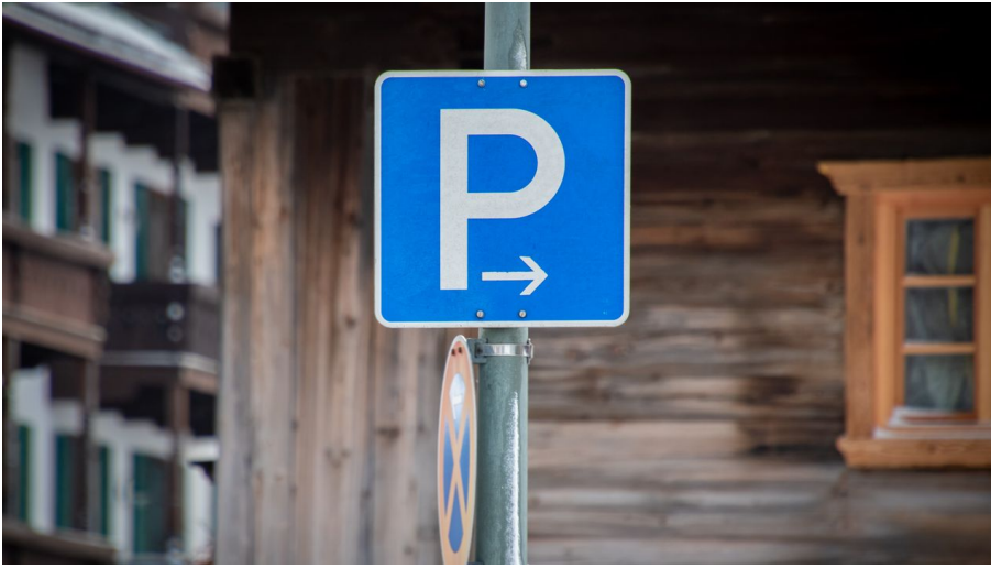
PP 2 - © Alpenregion Tegernsee Schliersee