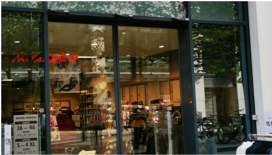
Jeans Fritz.jpg