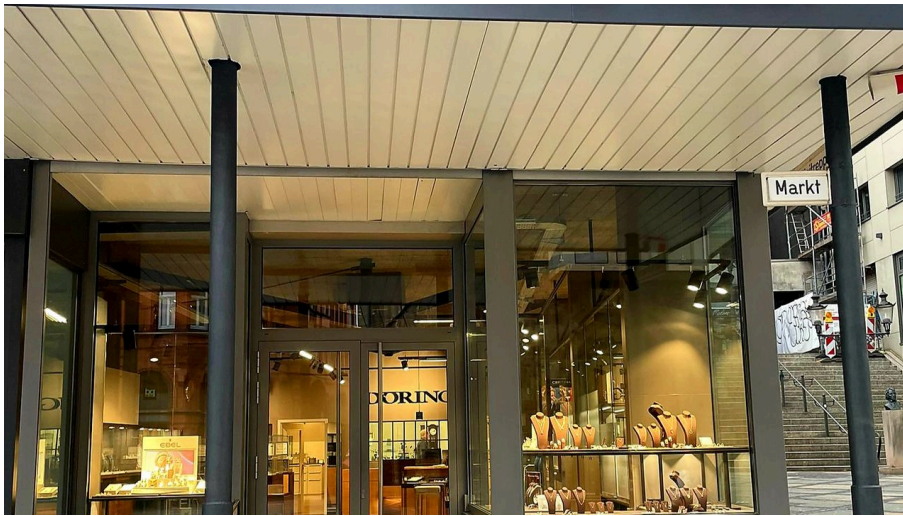
Juwelier Döring.jpg