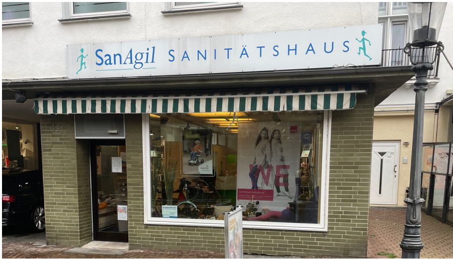
San Agil.jpg