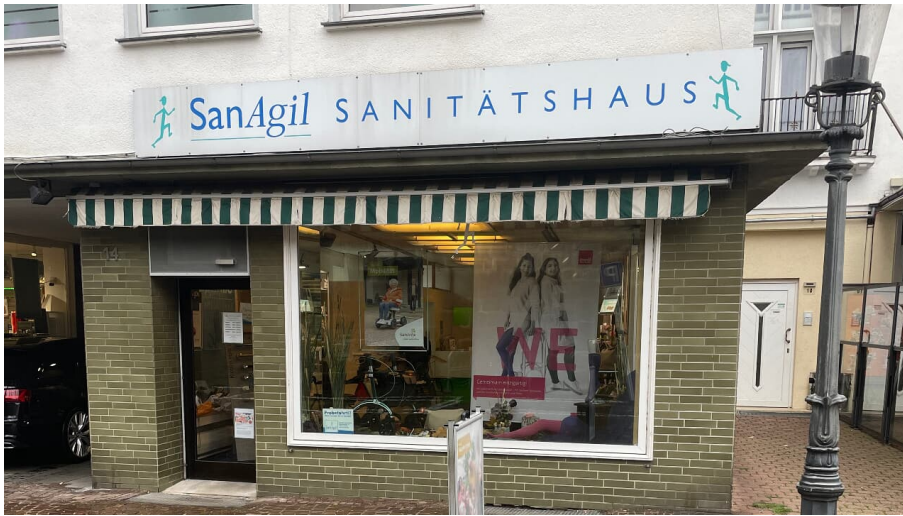
San Agil.jpg