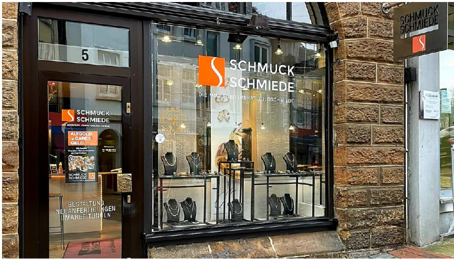
Schmuck Schmiede.jpg