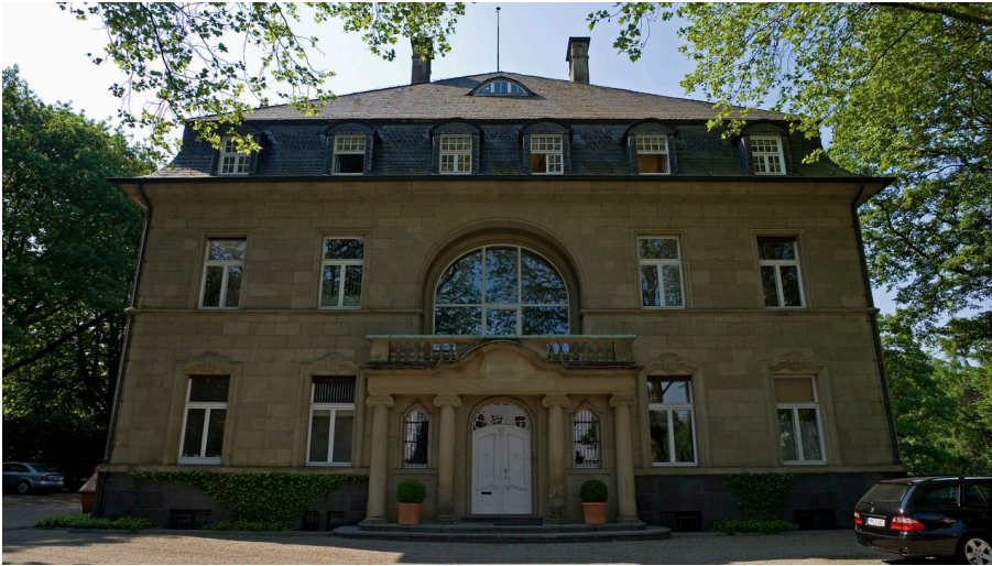
Haus Urge