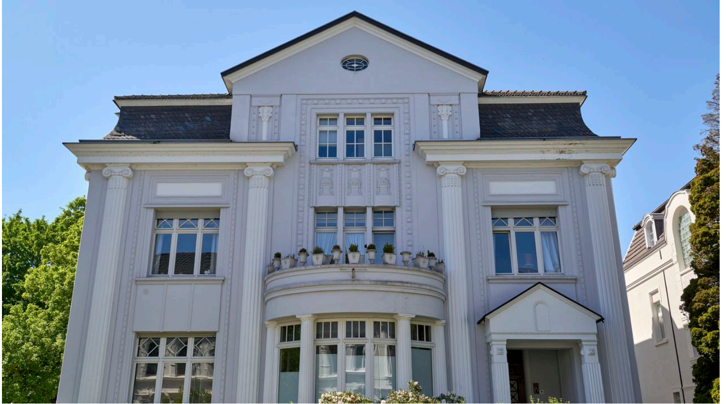
Die Friedrichstraße - #Straße der Millionäre# - © Anna Meurer