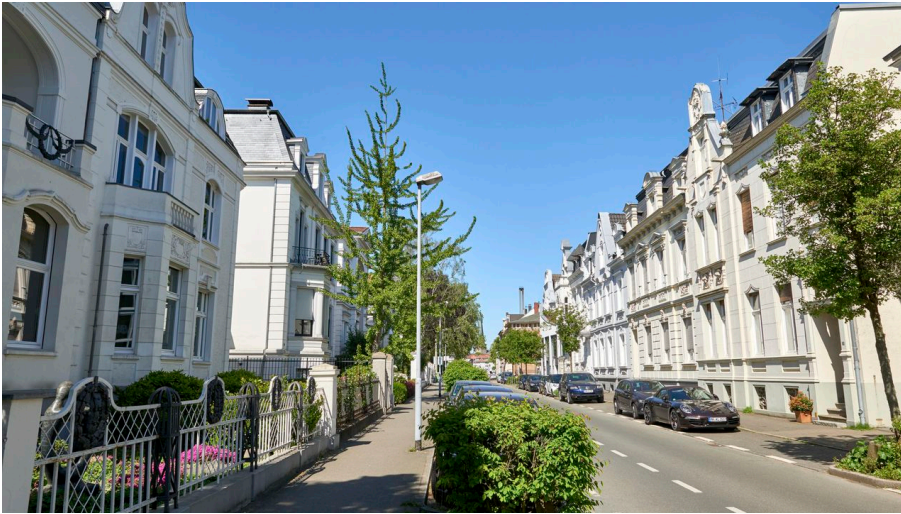
Die Friedrichstraße - #Straße der Millionäre#