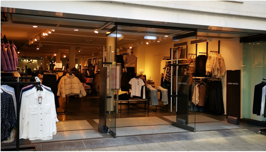
Vero Moda.jpg