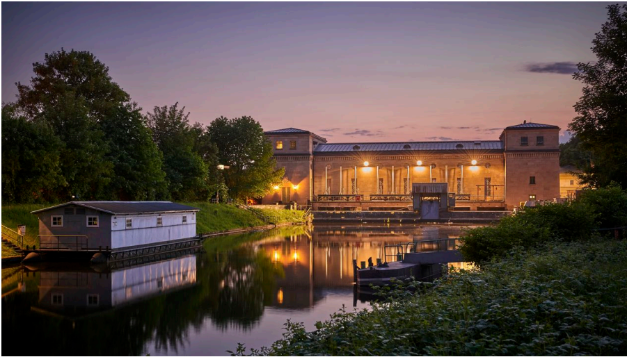
Wasserkraftwerk Raffelberg

Etwa 8 km von der Mündung in den Rhein entfernt ist die Ruhr hier in Schleusenkanal, Kraftwerkskanal und den alten Ruhrarm dreigeteilt. Die 1999 sanierte Raffelbergsschleuse hat für den Mülheimer Hafen und die dort angesiedelte Wirtschaft große Bedeutung.