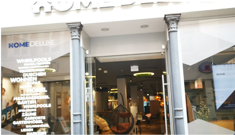
Home Deluxe.jpg