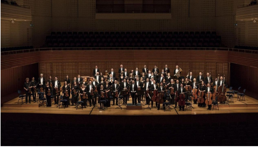
Luzerner Sinfonieorchester