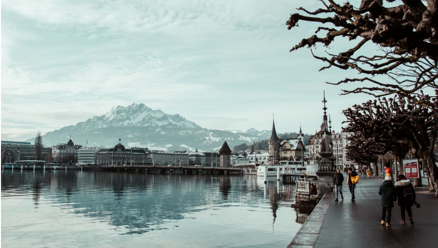
Seepromenade im Herbst