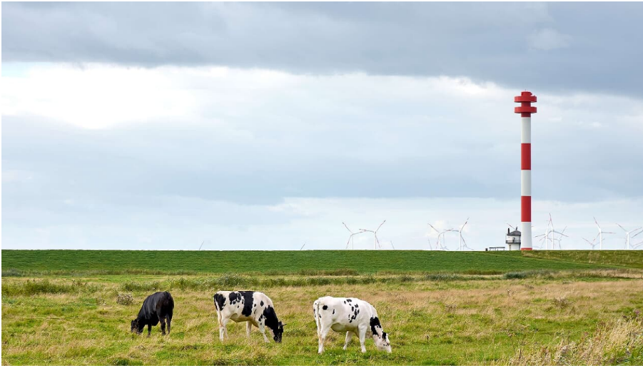
Kühe in Kehdingen - © Tourismusverband Landkreis Stade e.V.

Ausflugsziele Architektur, Infrastruktur, Kultur sonstige