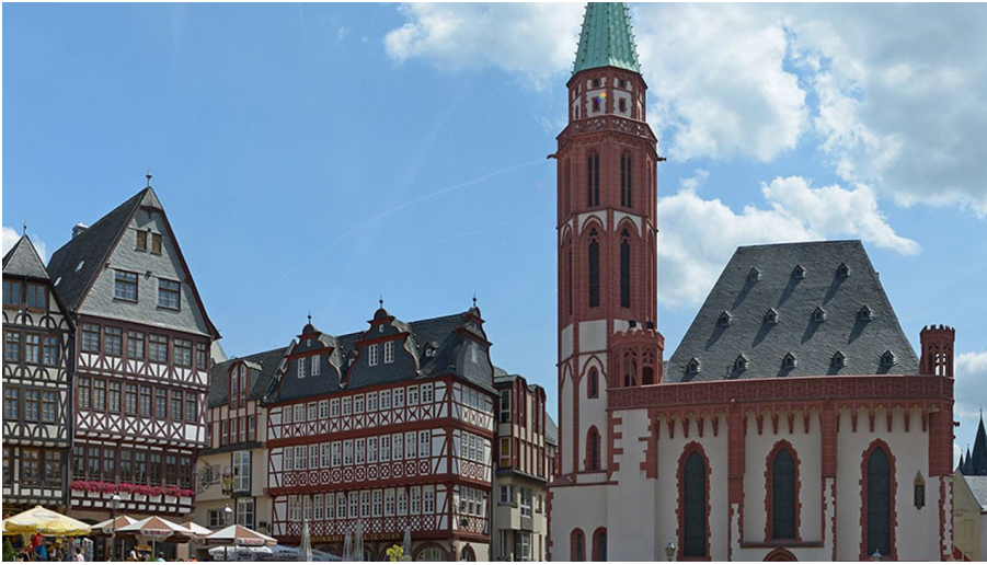
Alte Nikolaikirche