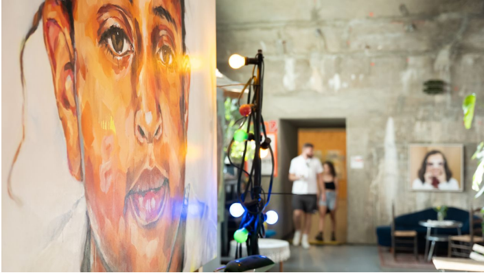
Frankfurt_Kunstverein_Familie_Montez_1040951_© #visitfrankfurt_plazy_Isabela_Pacini.jpg - © #visitfrankfurt_plazy_Isabela_Pacini