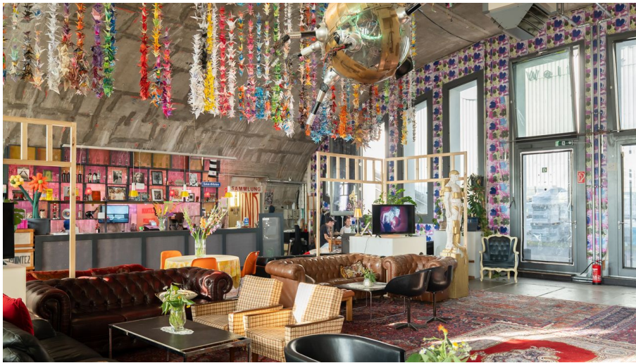
Frankfurt_Kunstverein Familie Montez_1040946_©#visitfrankfurt_Isabela_Pacini.jpg - © #visitfrankfurt_plazy_Isabela_Pacini