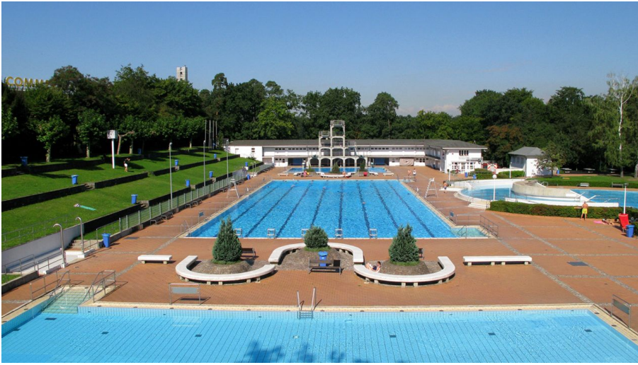
Freibad Stadion Stadionbad