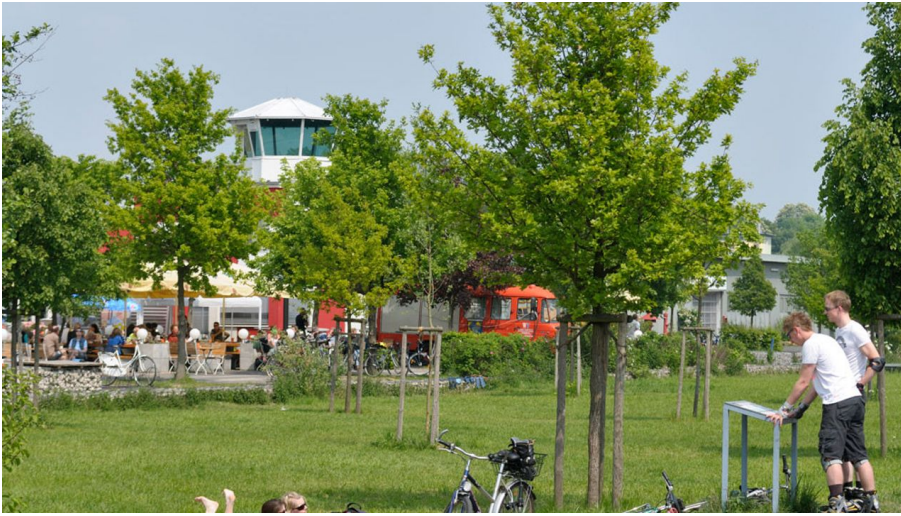
Alter Flugplatz Bonames