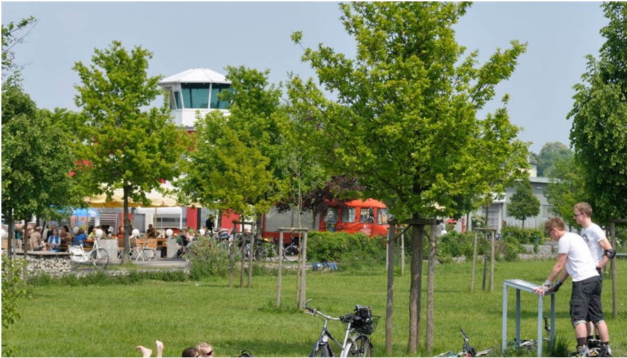
Alter Flugplatz Bonames