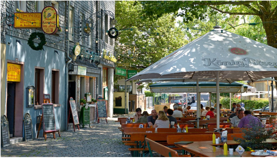
Sachsenhausen Apfelwein - © #visitfrankfurt