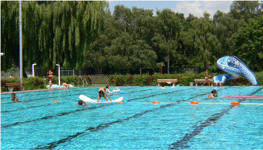
Freibad Nieder-Eschbach