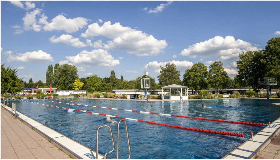
Freibad Silo Silobad