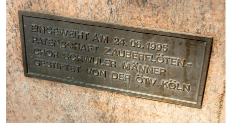
Mahnmal-KoelnTourismus-Seelbach_2371.jpg - © KölnTourismus, Foto: Christoph Seelbach