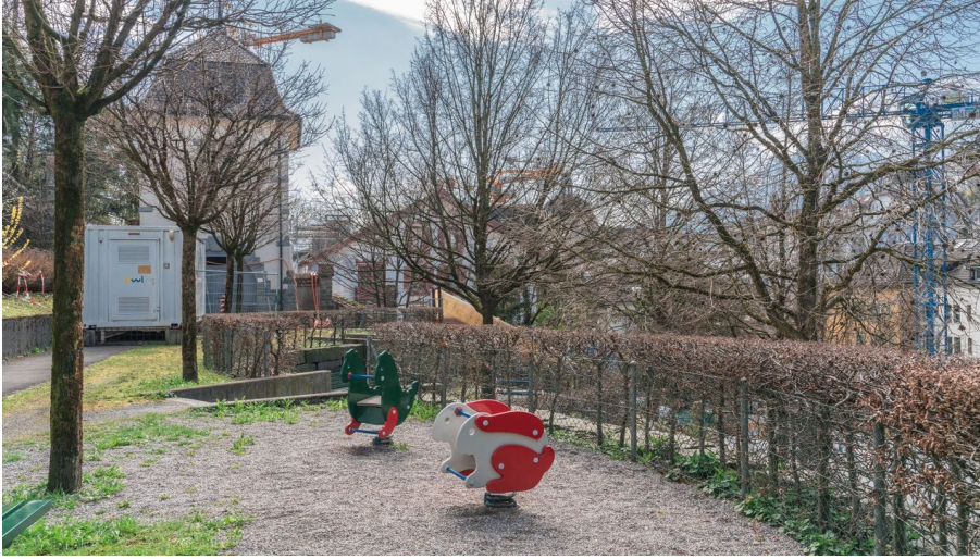
Laila Bosco, Luzern Tourismus AG