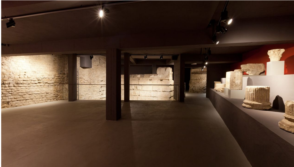
Ubirmonument-Roemisch-Germanisches-Museum-der-Stadt-Koeln-RBA-Wegner_1.jpg - © Römisch-Germanisches Museum der Stadt Köln / RBA / A. Wegner

Donnerstag, 04.09.2025, 14:00 - 17:00 Uhr Donnerstag, 02.10.2025, 14:00 - 17:00 Uhr Donnerstag, 06.11.2025, 14:00 - 17:00 Uhr