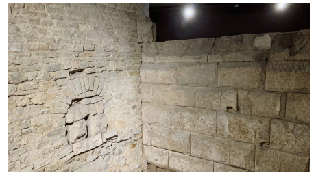
Ubirmonument-Jesse-von-Laufenberg_2.jpg - © KölnTourismus, Foto: Jesse von Laufenberg