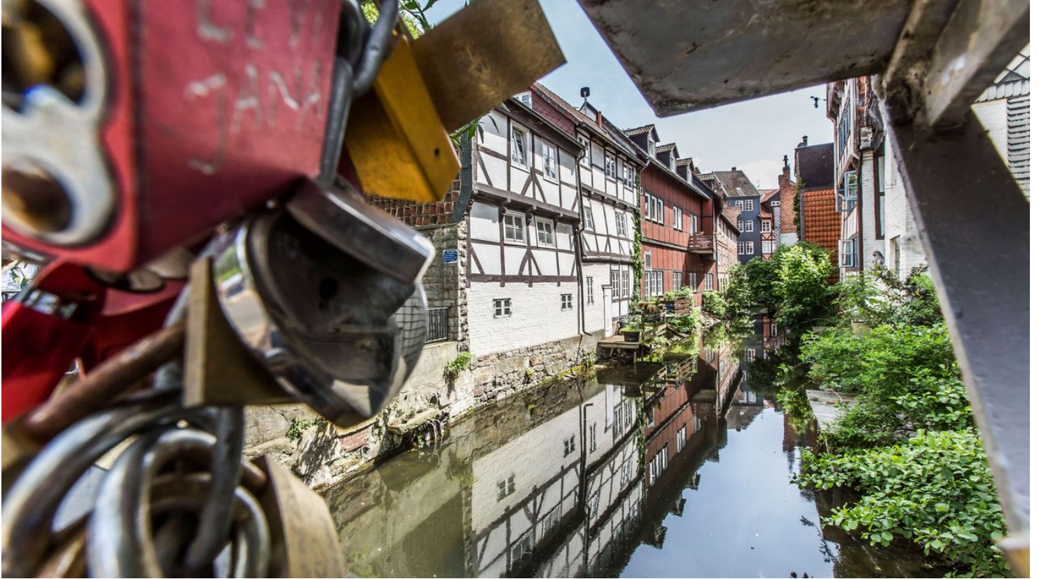
Klein Venedig Liebesschlösser