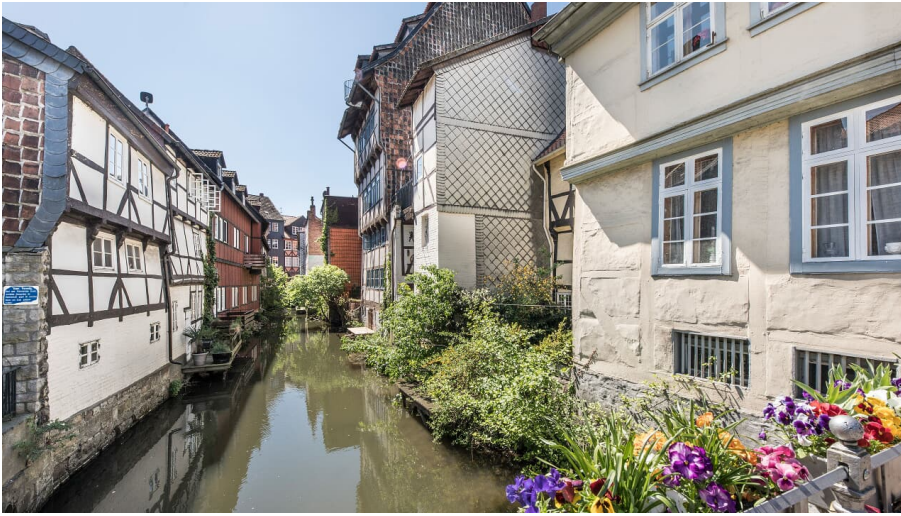
Klein Venedig