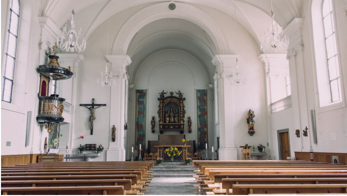
Pfarrkirche St. Maria