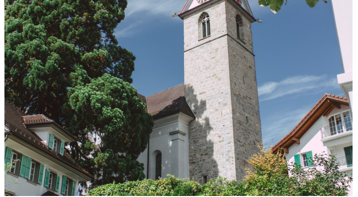
Pfarrkirche St. Maria