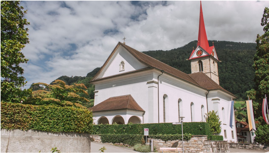
Pfarrkirche St. Maria