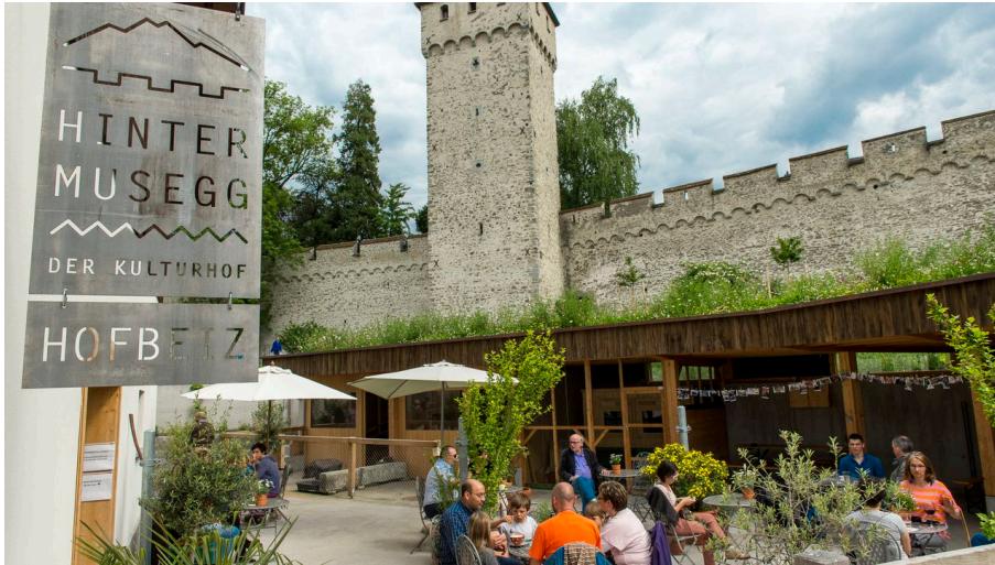
Hinter Musegg – la ferme culturelle - © Micha Eicher, Kulturhof Hinter Musegg