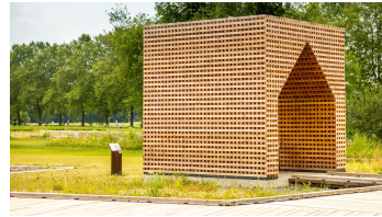
Hoexter-Landesgartenschauelände Archeologiepark-Stadt Hoexter-D. Ketz-2023-344.jpg