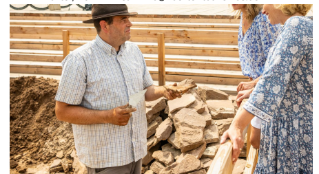
Hoexter-Landesgartenschauelände Archeologiepark-Stadt Hoexter-D. Ketz-2023-341.jpg