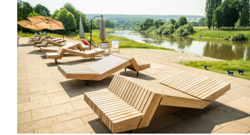
Hoexter-Weserradweg-Stadt Hoexter-D. Ketz-2023-299.jpg - - info@hoexter-tourismus.de