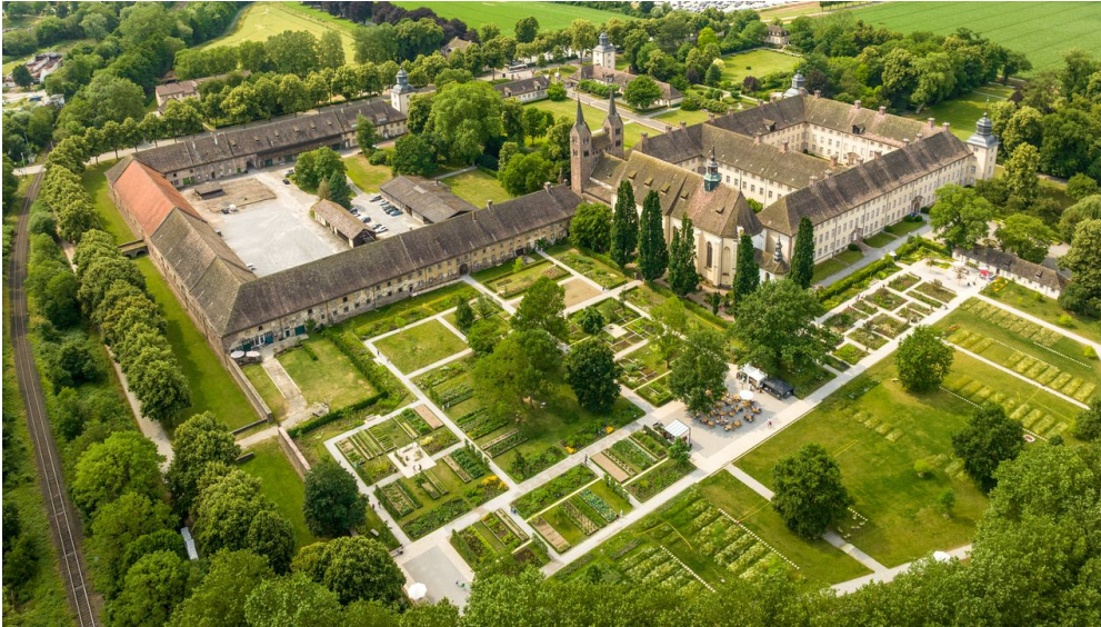
Hoexter-Kloster Corvey-Stadt Hoexter-D. Ketz-2023-449.jpg

Vom 24. März bis 1. November 2024 ist der Huxarium Gartenpark für Gäste geöffnet.