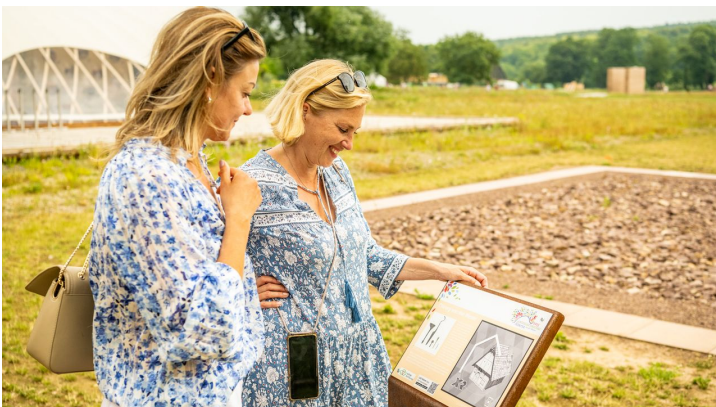
Hoexter-Landesgartenschauelände Archeologiepark-Stadt Hoexter-D. Ketz-2023-355.jpg