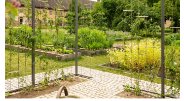
Hoexter-Landesgartenschauelände Remtergarten-Stadt Hoexter-D. Ketz-2023-396.jpg - - info@hoexter-tourismus.de