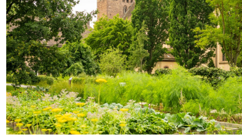
Hoexter-Landesgartenschauelände Remtergarten-Stadt Hoexter-D. Ketz-2023-393.jpg