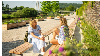
Hoexter-Weserufer-Stadt Hoexter-D. Ketz-2023-282.jpg