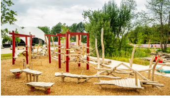
Hoexter-Landesgartenschauelände Archeologiepark-Stadt Hoexter-D. Ketz-2023-372.jpg