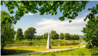
Hoexter-Weserradweg-Stadt Hoexter-D. Ketz-2023-321.jpg