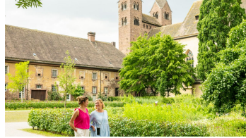
Hoexter-Landesgartenschauelände Remtergarten-Stadt Hoexter-D. Ketz-2023-409.jpg