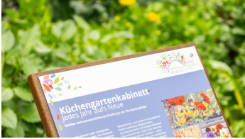
Hoexter-Landesgartenschauelände Remtergarten-Stadt Hoexter-D. Ketz-2023-395.jpg