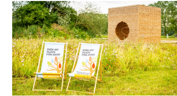
Hoexter-Landesgartenschauelände Archeologiepark-Stadt Hoexter-D. Ketz-2023-371.jpg - - info@hoexter-tourismus.de