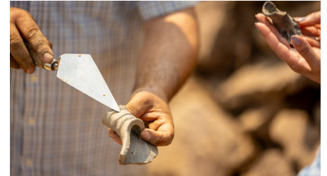
Hoexter-Landesgartenschauelände Archeologiepark-Stadt Hoexter-D. Ketz-2023-337.jpg