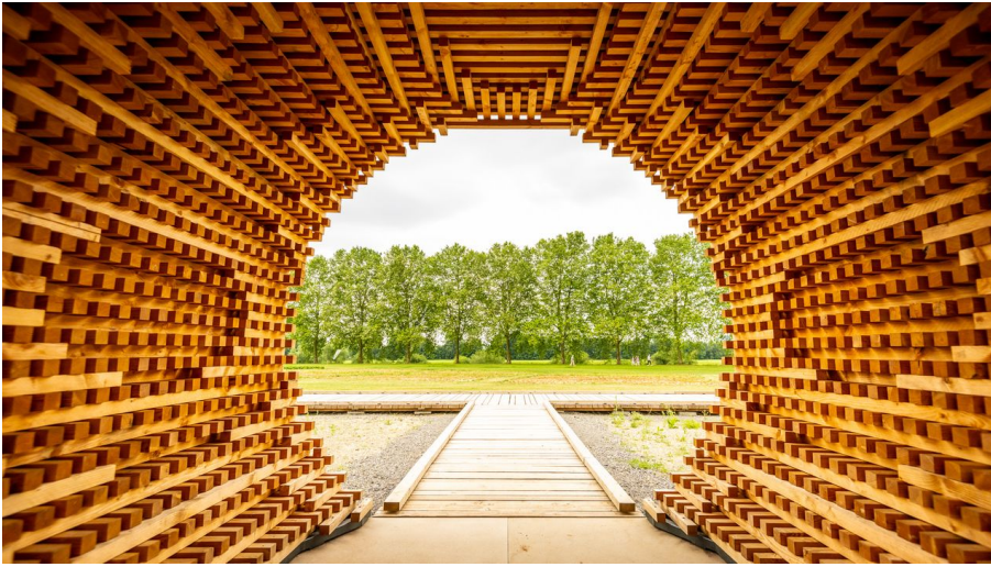
Hoexter-Landesgartenschau Gelände Archeologiepark-Stadt Hoexter-D. Ketz-2023-364.jpg