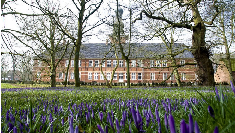
Das Husumer Schloss während der Krokusblüte