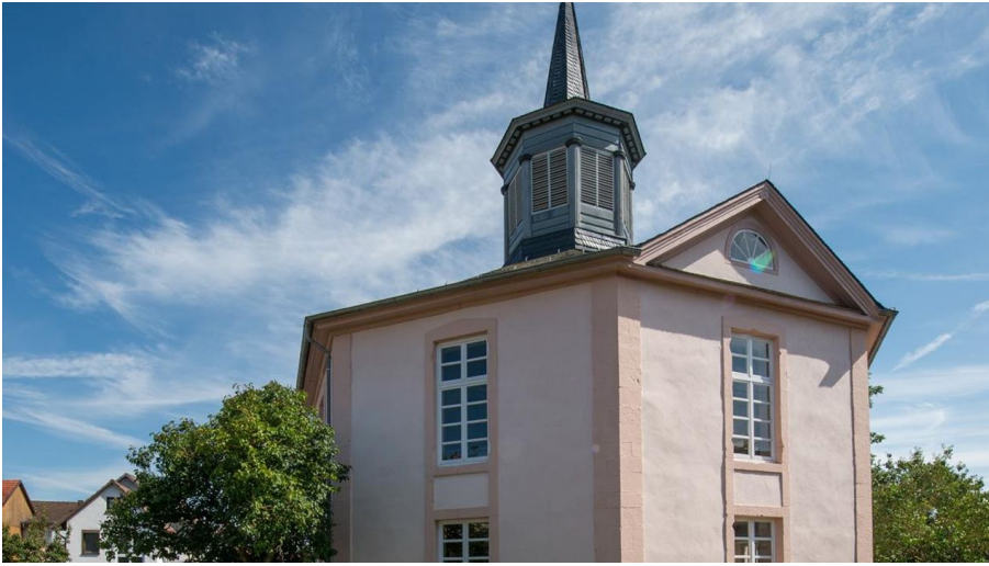
Kirche Heimarshausen