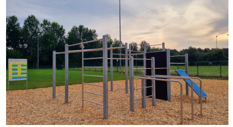
Bewegungspark im Sportpark am Ölbach Stukenbrock