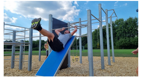
Bewegungsparcours im Sportpark am Ölbach SHS