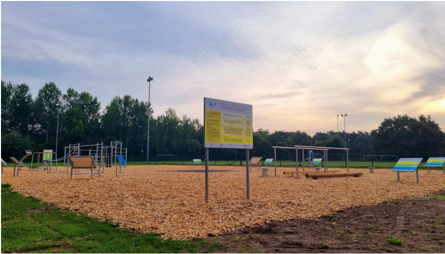
Bewegungspark im Sportpark am Ölbach Stukenbrock