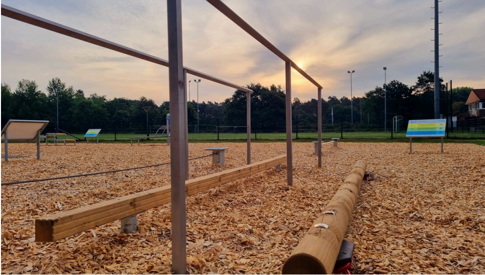
Bewegungspark im Sportpark am Ölbach Stukenbrock