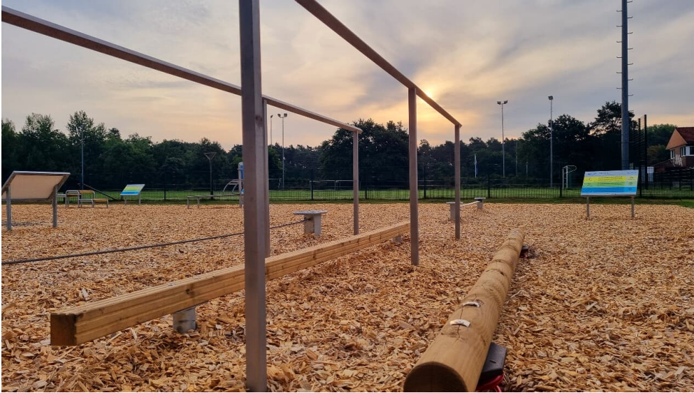
Bewegungspark im Sportpark am Ölbach Stukenbrock