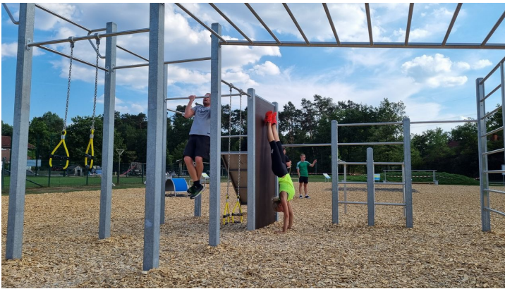
Bewegungsparcours im Sportpark am Ölbach SHS