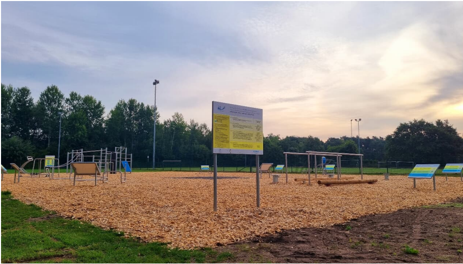
Bewegungspark im Sportpark am Ölbach Stukenbrock